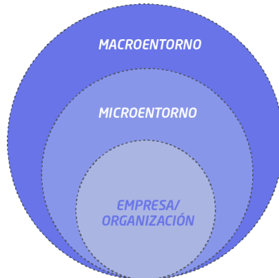
Figura 1: El entorno.

Podemos distinguir en macroentorno, microentorno, empresa y organización, tal como se muestra a continuación: