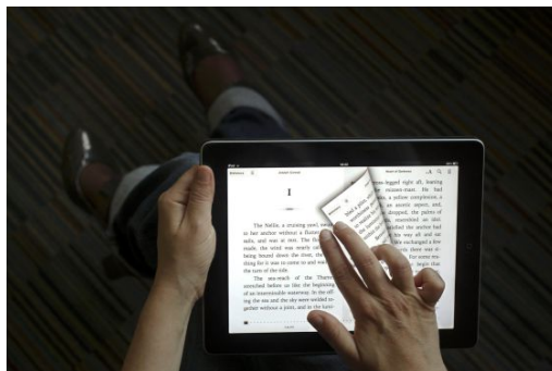
Figura 1. Libro en formato digital (e-book)